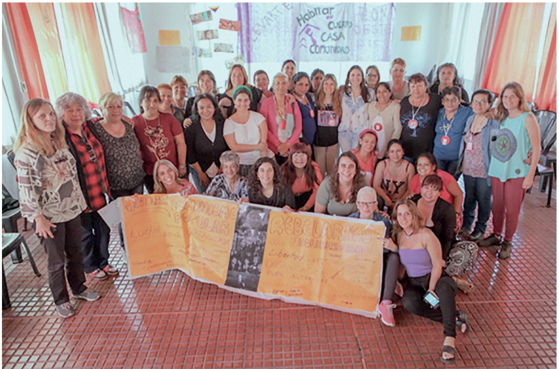
Taller de fin de año del grupo Elevarte, 2017.

Algunos de los temas que hemos trabajado y reflexionado a lo largo de estos años en los talleres, complementando la intervención en hábitat popular a fin de fortalecer al grupo de promotoras y su organización, han sido: