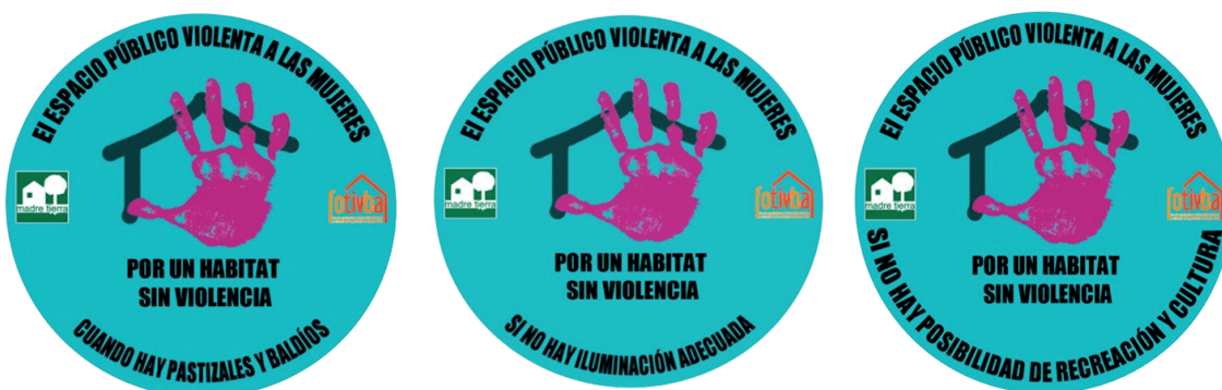
Logos diseñados para campaña en espacio público, Madre Tierra, 2016.

Son las mujeres, como se puede visualizar en los recorridos y dificultades expresados, quienes utilizan de manera intensiva las calles del barrio, al desarrollar las tareas tradicionales de cuidado del hogar y de las personas (niños/as, ancianos/as), sufriendo las consecuencias de la falta de servicios, accesibilidad, mantenimiento y seguridad. En el caso del grupo de promotoras barriales, a partir de trabajar los recorridos urbanos en el barrio y en los talleres mencionados, surgieron propuestas para poder intervenir y visibilizar esta problemática, realizando intervenciones urbanas: embellecimiento de algunos espacios (plazas, paradas de colectivos, etc.) a través de murales, pintadas, grafitis, mensajes de denuncia, stickers ; colocación de luminarias en la vía pública, en las calles de acceso al barrio más transitadas; realización de algunas propuestas al gobierno local (como por ejemplo que el recorrido de los transportes públicos contemple el circuito de las mujeres en el distrito según la ubicación de determinados servicios como salud, educación, recreativos utilizados por ellas y sus hijos; limpieza y mantenimiento de lugares baldíos, luminarias en espacio público) y a los transportes públicos que transitan los barrios en cuanto a la movilidad urbana, según los recorridos más utilizados en las tareas diarias no contemplados por los mismos.